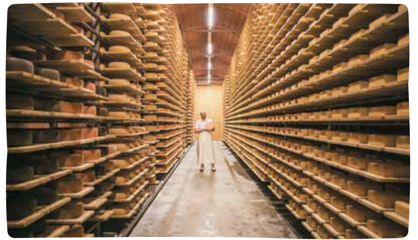
Der Naturziegelkeller gewährt ein natürliches Reifeklima bei gleichbleibender Luftfeuchtigkeit und Temperatur.

URIGER ALLGÄUER Im Naturkeller gereifter Schnittkäse. Der cremige Teig ist mit Schabziger Kleesaat affiniert. Überzug nicht zum Verzehr geeignet. Lab: mikrobielles Lab. Fettgehalt: 50% i.Tr. Reifezeit: 6 Wochen